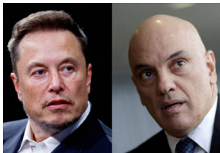
Elon Musk e Alexandre de Moraes: decisões da Justiça brasileira não cumpridas

Como Moraes decidiu enviar o processo para julgamento da Primeira Turma, e não do plenário