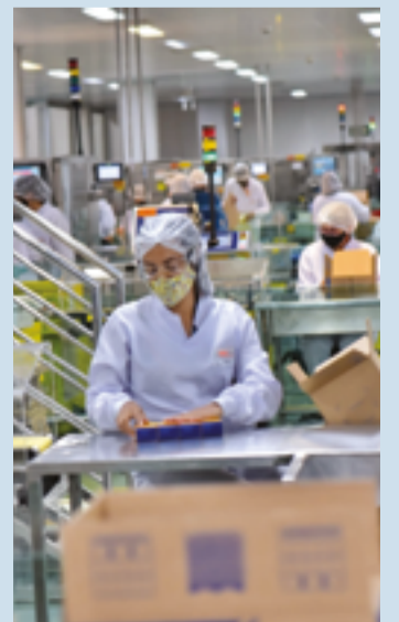
As atividades que se destacaram no setor de serviços foram outros serviços (15,6%), comércio (14,8%), informação e comunicação (9,9%)