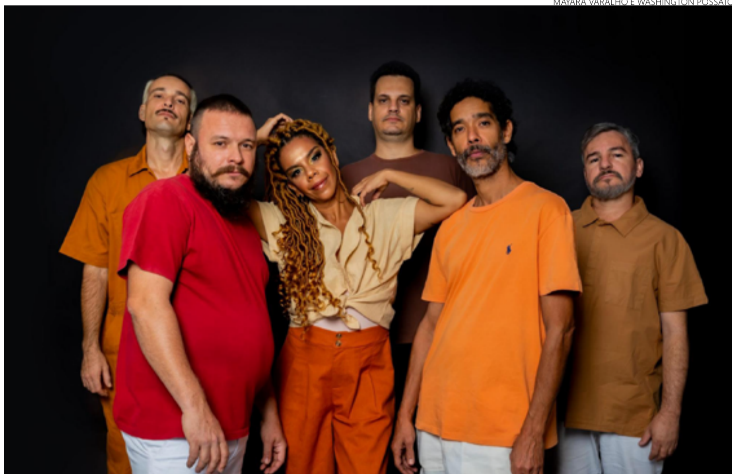
Música preta brasileira: Mundhumano leva para Piri repertório de samba-rock conhecido nos bares da Capital

O Palco Teatro, situado no Teatro Pompeu de Pina, não só abrirá o festival, como também servirá como local de gravação para o Estúdio Primavera. Já o Palco Matriz, na Praça da Matriz, e o Palco Coreto, na Praça do Coreto, continuam a ser espaços tradicionais e importantes para o evento. Mundhumano