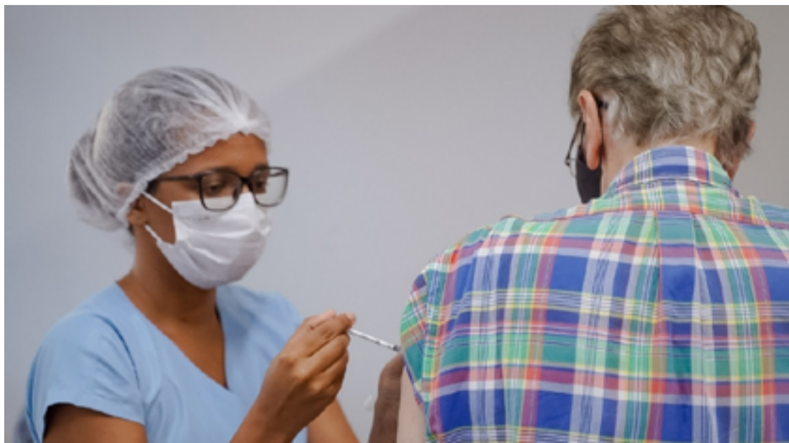
Grupos prioritários devem receber dose de reforço anual da vacina contra a covid-19 em uma das mais de 900 salas de imunização do estado

Devem receber uma dose de reforço anual os grupos priori-