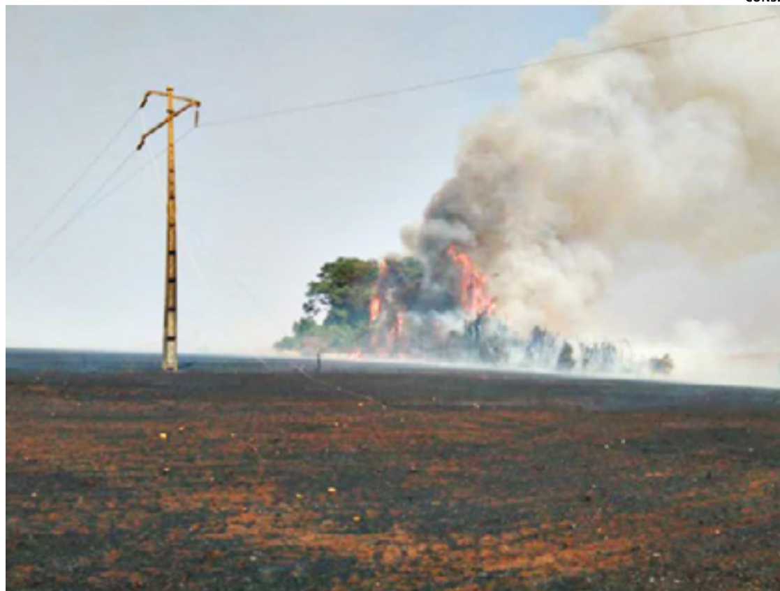
De janeiro a agosto, 130 focos de queimadas atingiram rede de energia em Anápolis e outras cidades goianas

Nas últimas semanas a rede de distribuição da Equatorial Goiás sofreu danos devido a duas queimadas no estado. No dia 23 de agosto um incêndio em Caiapônia durou mais de 72 horas, danificando estru-