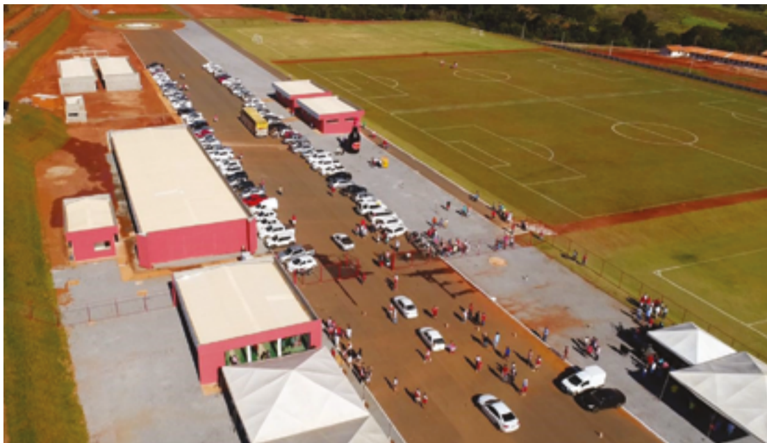
Centro de Treinamento Leandro Ribeiro, 98,8 mil m 2 : depois da torcida colorada, o maior patrimônio da Rubra