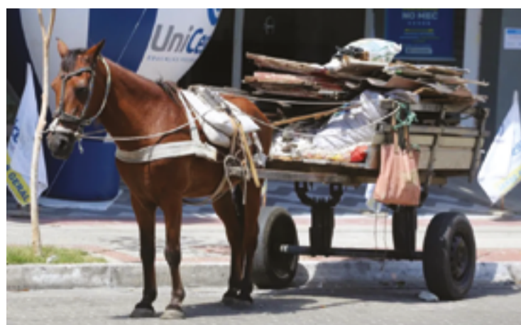
Legislação prevê que, em 4 anos, circulação seja totalmente proibida na cidade

Os veículos deverão ainda possuir, obrigatoriamente, arreios ajustados à anatomia do animal, e local reservado ao