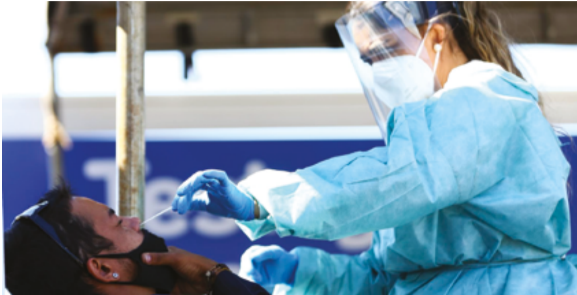
Os dados apontam um avanço da doença no estado, com 4.629 casos confirmados em agosto e 2.318 em julho

Em 2024 já foram confirmados 56.729 casos e 133 mortes por Covid-19 no estado. Apenas entre os dias 28 de janeiro e 2