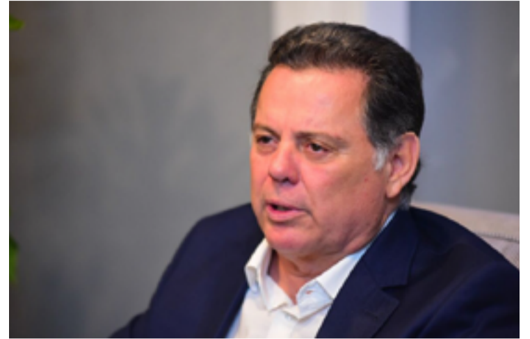
Ex-governador Marconi Perillo