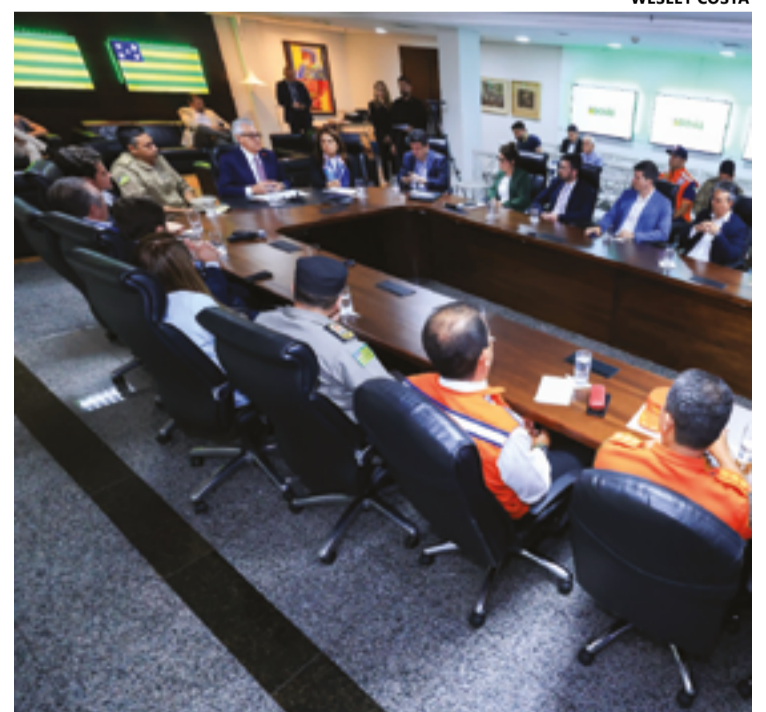
Proposta encaminhada à Assembleia cria a Política Estadual de Segurança Pública de Prevenção e Combate ao Incêndio Criminoso no Estado de Goiás

Publicado na sexta-feira, 30, no DOE, o Decreto nº 10.539 tem vigência por 180 dias e abrange 20 cidades mais afetadas pelas consequências dos incêndios florestais, com queda na qualidade do ar. São elas: Anápolis, Caldas Novas, Ceres, Goianésia, Goiânia, Inhumas, Iporá, Itaberaí, Itumbiara, Jaraguá, Luziânia, Morrinhos, Palmeiras de Goiás, Pires do Rio, Quirinópolis, Rialma, Santo Antônio do Descoberto, Senador Canelo, Silvânia e Trindade. Entre outros pontos, a iniciativa autoriza dispensa de licitação; entrada em casas para prestar socorro; e contratação de pessoal para minimizar o impacto das queimadas. (Com informações Secom)